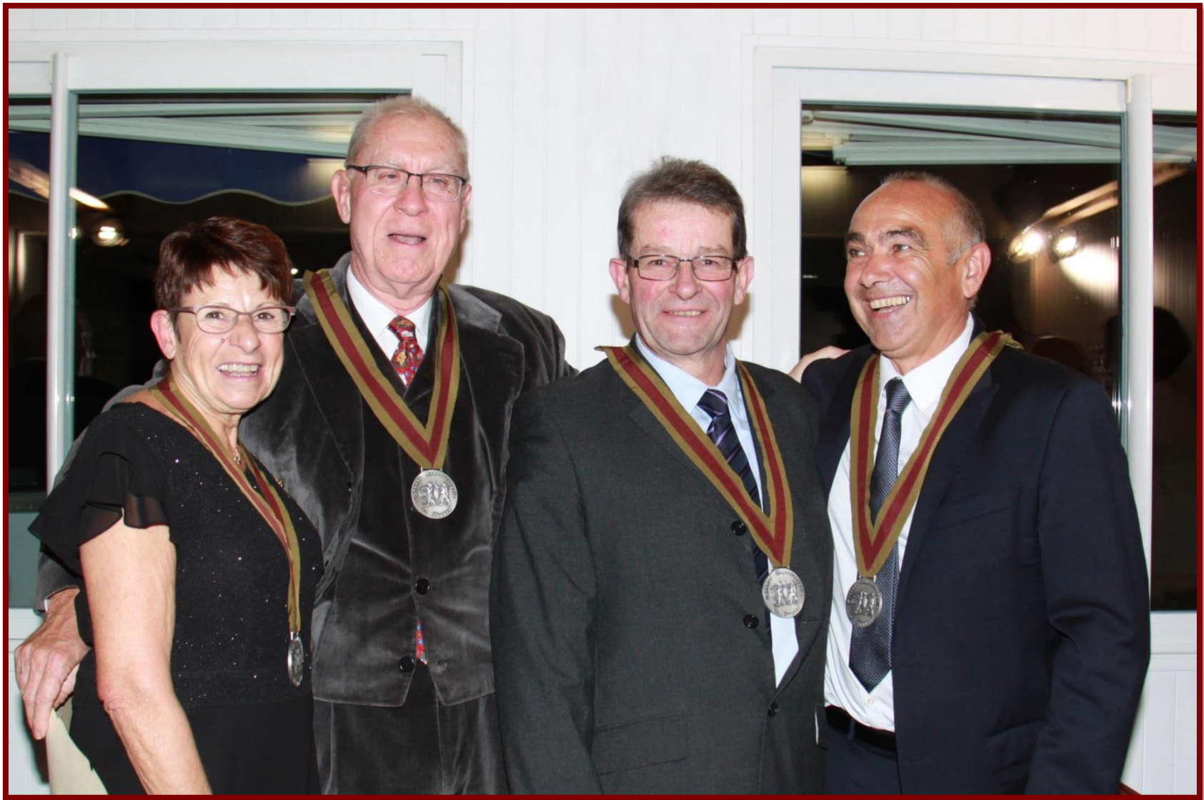
Grande Echansonnerie de France Confrérie des Echansons Ligériens Promotion 2016