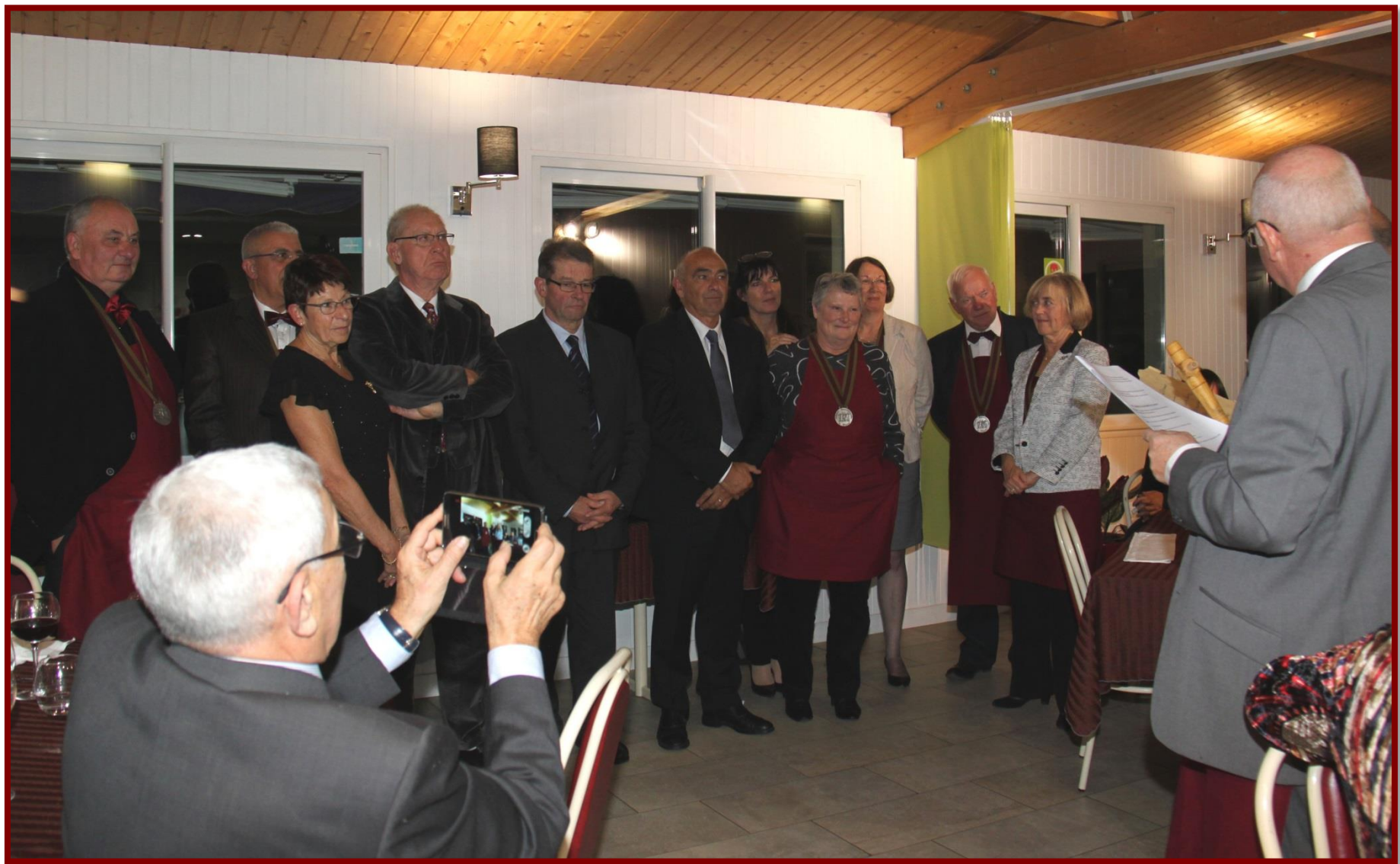
Le Maître Laudateur (à droite, hors champ) termine : « Nous prenons acte de votre promesse. »